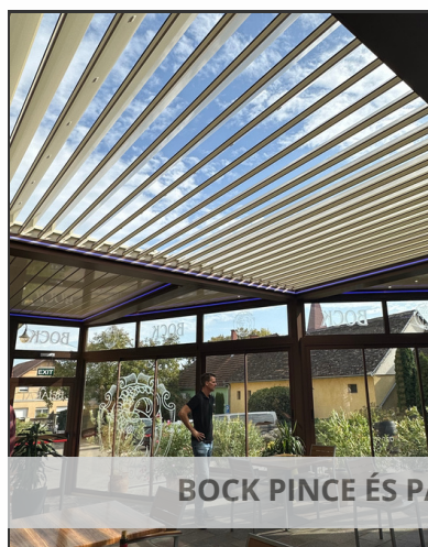
BOCK PINCE ÉS PANZIÓ - Villány