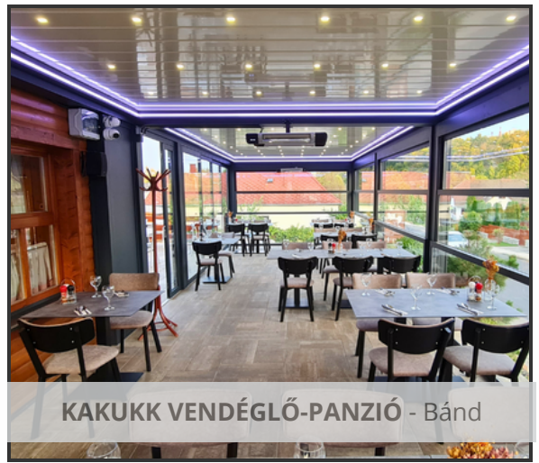
KAKUKK VENDÉGLŐ-PANZIÓ - Bánd