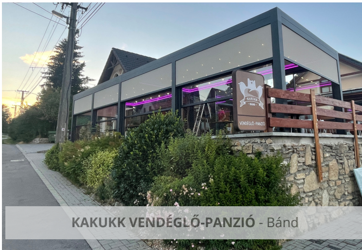
KAKUKK VENDÉGLŐ-PANZIÓ - Bánd