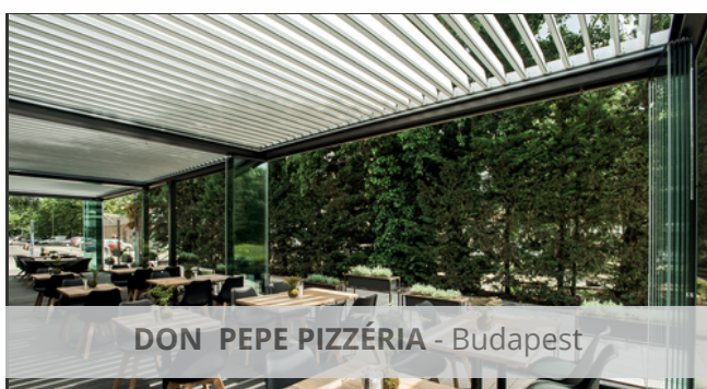
DON PEPE PIZZÉRIA - Budapest