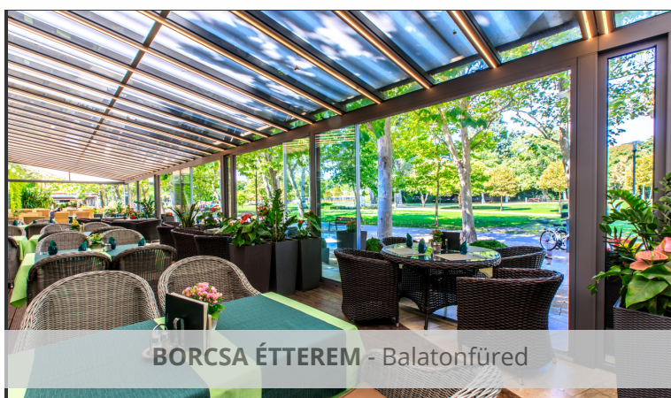
BORCSA ÉTTEREM - Balatonfüred