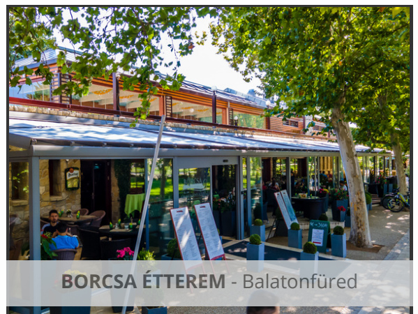
BORCSA ÉTTEREM - Balatonfüred