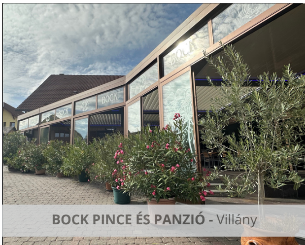
BOCK PINCE ÉS PANZIÓ - Villány