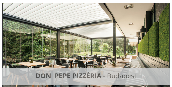
DON PEPE PIZZÉRIA - Budapest